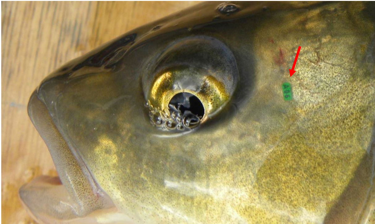
Abb.1.: Individuelle Markierung eines Aitels (Code: A06)

Die Lizenznehmer werden gebeten, gefangene Fische kurz zu kontrollieren und bei Vorhandensein einer visuellen Markierung den Code und soweit möglich auch den ungefähren Fangort in der Fischereilizenz einzutragen. Gefundene Transponder können an uns geschickt werden.